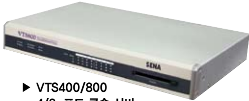
▶ VTS400/800 4/8-포트 콘솔 서버