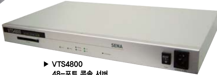
▶ VTS4800 48-포트 콘솔 서버