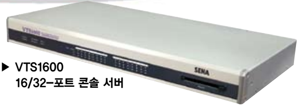
▶ VTS1600 16/32-포트 콘솔 서버